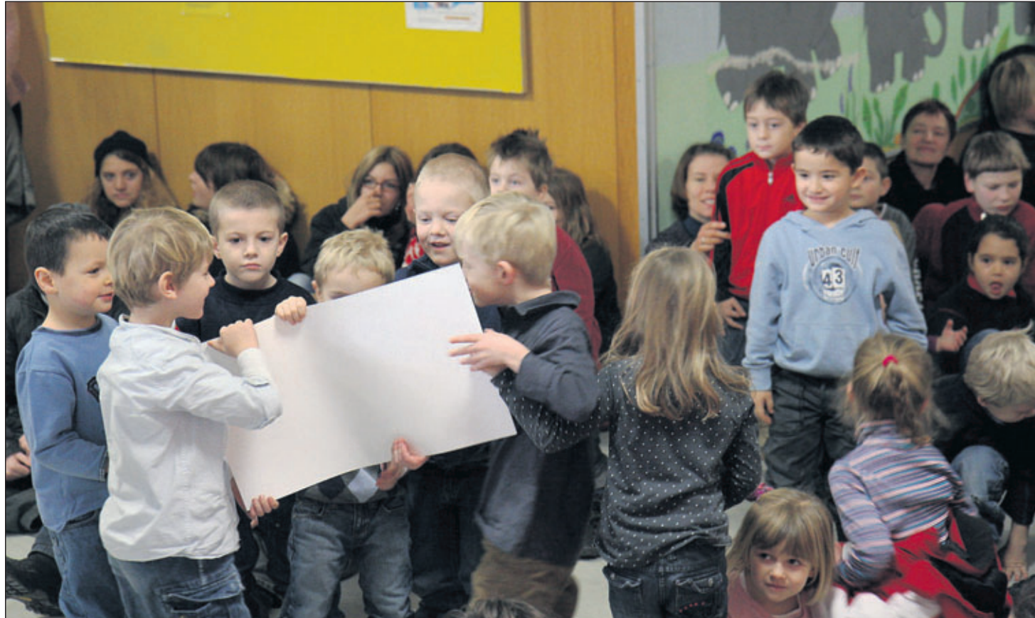
Die Freude bei den Kindern war groß, als sie die Schecks für ihren Einsatz beim Äpfelauflesen erhielten.